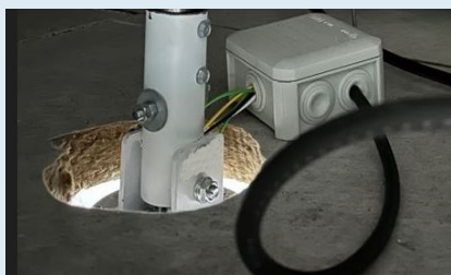
Trou à la scie cloche dans faux plafond