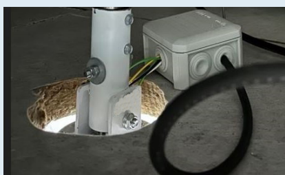
Trou à la scie cloche dans faux plafond