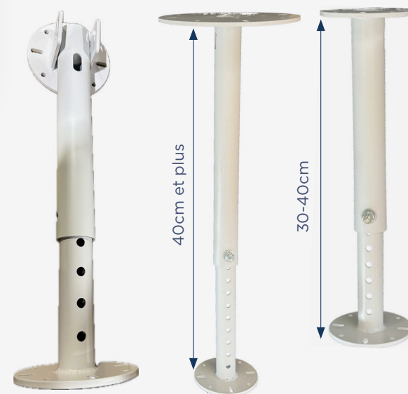
Tige télescopique & inclinable